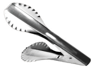
Pegador de Pão - Doupan