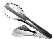
Pegador de Pão - Doupan