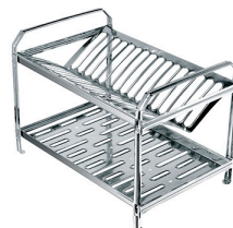
Escorredor de Pratos Luxo - Dincox