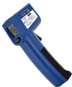
Termômetro Infravermelho -38°C a 365°C - Incoterm