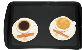
Bandeja p/Café Preta 34x23cm - Supercrow