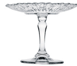
Porta Cupcake Patisserie- Pasabahce