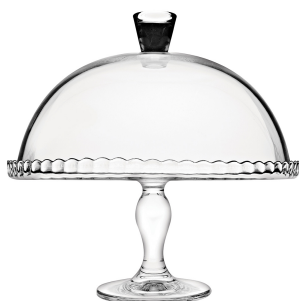
Prato de Bolo c/Pé e Tampa - Patisserie - Pasabahce