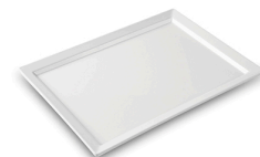
Bandeja Creme- Efay