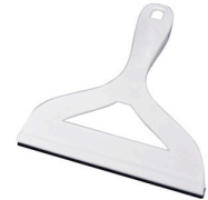
Rodo de Pia - Plasvale