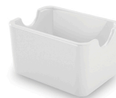
Porta Sachês 6x9cm - Efay