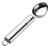
Colher de Sorvete 19cm-Sunnex