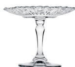
Porta Cupcake Patisserie- Pasabahce