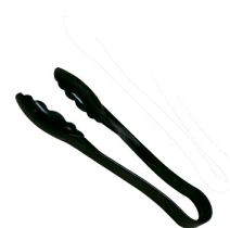
Pegador Preto-24cm - Efay