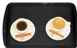
Bandeja p/Café Preta 34x23cm - Supercrow