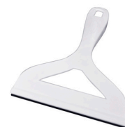
Rodo de Pia - Plasvale