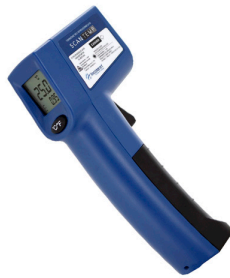
Termômetro Infravermelho -38°C a 365°C - Incoterm