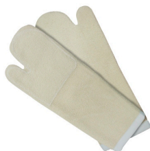
Luva Grafatex 350°/15 Seg - Lamare Mundial